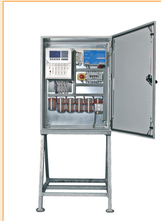
Sila Controll (K8)